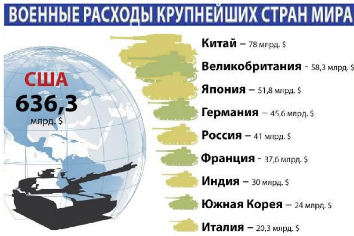
Рисунок 3 – Военные расходы крупнейших стран мира