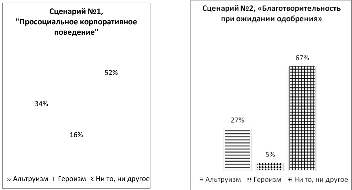
Рисунок 2 – Сценарии №1 и №2

Анализ третьего сценария – «Безвозмездный труд на благо детей» – показал преобладание идеи альтруизма по отношению к описанной ситуации (69%), 23% не нашли проявлений ни героизма, ни альтруизма. Четвертый сценарий – «Работа в «горячей точке» по собственному желанию» – был оценен как истинно героический (75% респондентов высказались “за”), также 20% опрошиваемых описали ситуацию как содержащую альтруистический поступок. Распределение ответов респондентов представлено на рисунке 3.